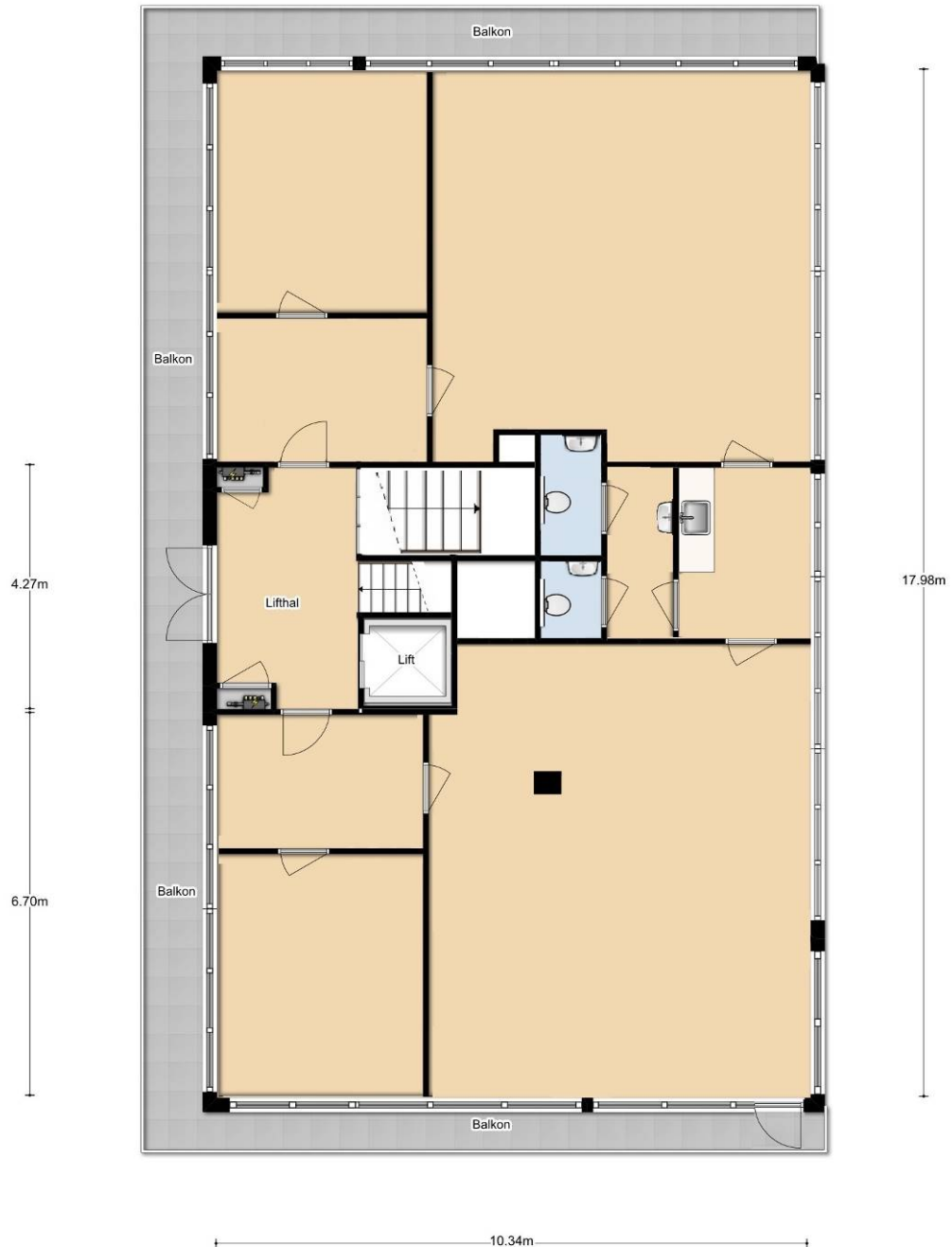
2e verdieping - gespiegeld