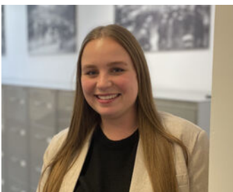
Demi Hopman Binnendienst